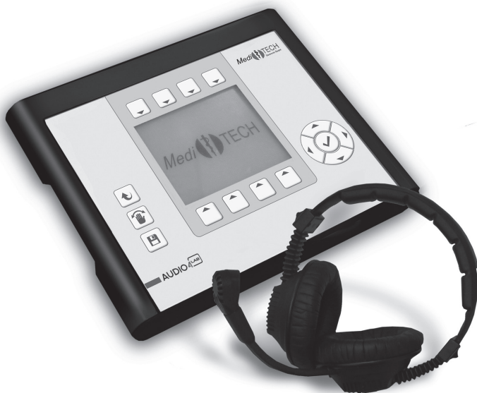
Ein weiteres neuentwickeltes Hilfsmittel ist der sogenannte Lateraltrainer.

Die hier zu Grunde liegende Annahme ist, dass schnelle Zeit- und Frequenzverarbeitung zur Laut- und Wortentschlüsselung führt und dem Sprachverstehen dient. Verstärkend können bei diesem Training unterschiedliche Schwierigkeitsgrade und Störgeräusche eingestellt werden, damit der Teilnehmer zudem erlernt, Wichtiges von Unwichtigem zu unterscheiden.