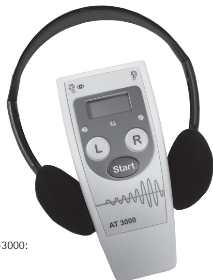
Der Audio-Trainer AT-3000: